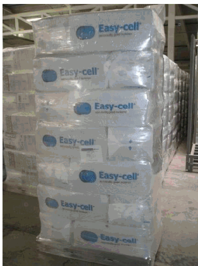
Easycell op pallets

Hier valt op eenvoudige wijze iets aan te doen met Easycell Classic, en dat zonder ingrijpende en dure verbouwing. Door jarenlange toepassing van dit product in verschillende landen heeft het product zijn kwaliteiten ruimschoots bewezen. Vele testen door onafhankelijke instanties hebben de uitstekende eigenschappen aangetoond en in certificaten vastgelegd.